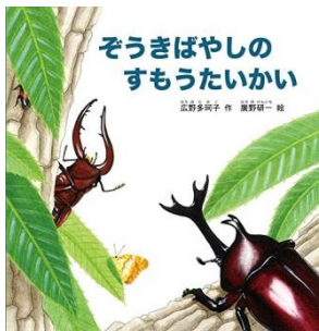
分類 EN ヒロ

優勝がかかった大一番。小柄な力士が大横綱にいざ、勝負！はっきょい、どーんとぶつかりあう体と体。相撲の魅力がぎゅっと凝縮された痛快絵本です。 やまもとななこ／作 講談社／出版