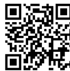
▲電子図書館 QR コード

①市立図書館ホームページのリンクから、またはQRコードを読み取って電子図書館のサイトにアクセスします。